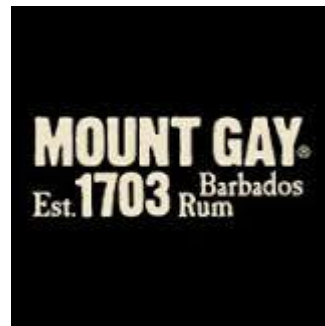
MOUNT GAY BARBADOS RUM