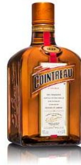
COINTREAU ORANGE LIQUEUR